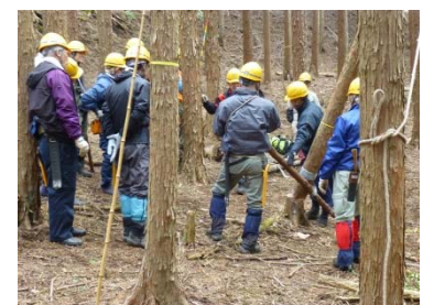
木回しによる処理方法の確認。

かかり木の処理は、間伐作業において一番危険を伴う作業のひとつです。今回の研修で学んだことをこれからの作業に活かすよう、お願いします。