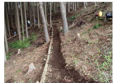
歩きやすい道を作りましょう！

当日の参加者数の都合もあるとは思いますが、5名体制の「道作り班」を一班編成し実施しますので、参加者の募集をお願いします。