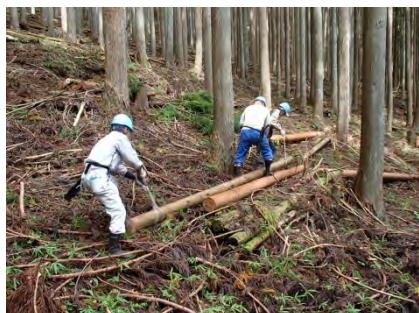
運搬は体勢を整えてゆっくりと。