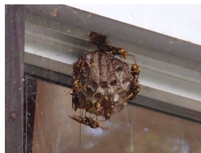
セグロアシナガバチの巣。

※ 9月26(水)は、曇り時々雨、最高気温22度、降水確率60%の予報となっています。