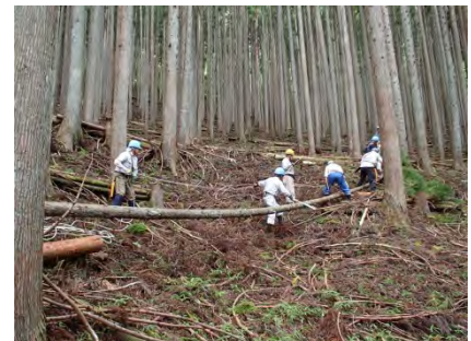
浮いた材の玉切りに注意！