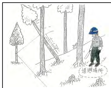
「伐木造材作業者必携より一部抜粋」