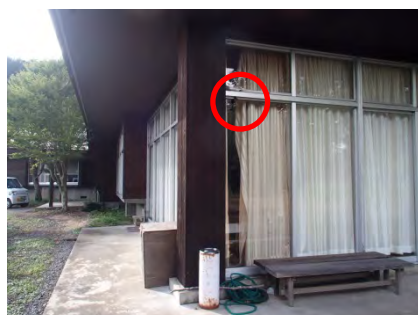
この場所にありました。

今後も皆さんの活動ルート上での異変に気付いた場合は、職員まで報告をお願いします。