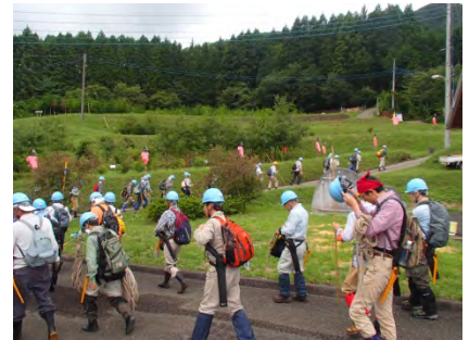
今日も一日よろしくお願いします。