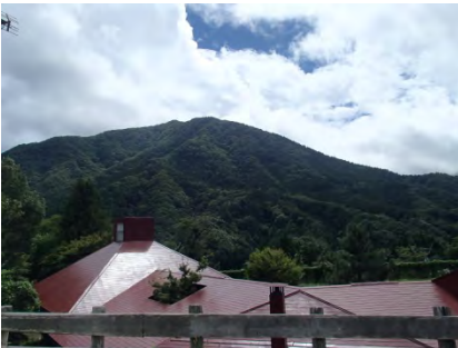
雲の多い空模様となりました。