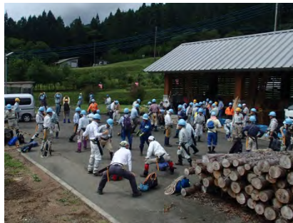
準備体操は、各班ごとにしっかりと。