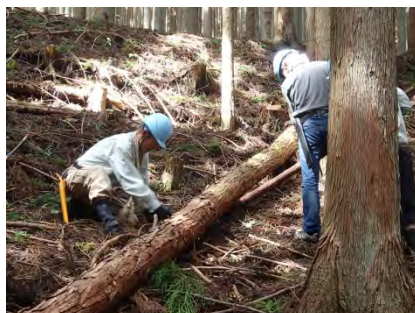
ノコギリの挟まれにも注意。