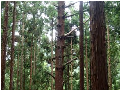
伐倒時は、松の枯れ枝に注意！