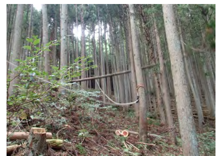
滑車を移動し、横に引いて見事に伐倒。