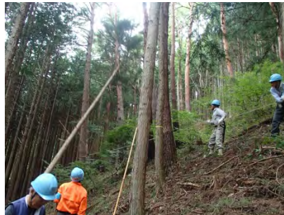
周りの松をよけて上手に伐倒。