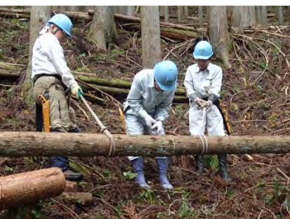
鋸の挟まれ防止に補助を。