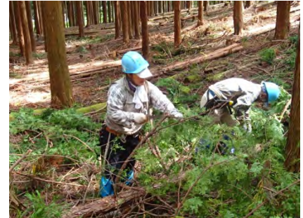
枝払いも気を付けて。