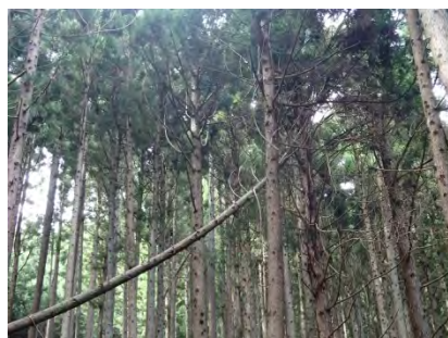
今回もかかり木が発生。