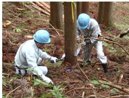
追い口は、受け口を確認しながら。