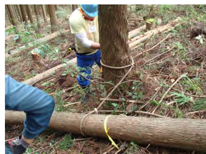
危険な滑り落ちの防止処置を。