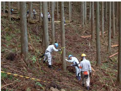
安全のため、ロープを延長。