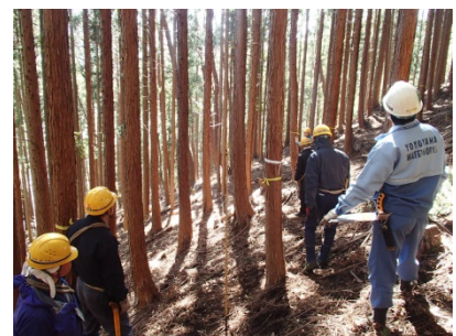
伐倒方向、伐倒方法の確認。

※ 道志村は、まだまだ肌寒い時があります。一枚羽織る物などを用意してご参加ください。