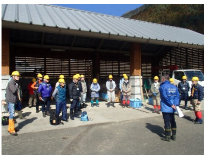
管理所長のあいさつ。

当日は、「伐倒目標の決定など、間伐作業の基本技術の再確認と技術向上を図る。」ことを目的に19名が参加されました。午前中は今年度の全作業区を一巡し、午後からは3班に分かれ、あらかじめ決めておいた伐倒難易度の高い対象木の伐倒方向や伐倒の順番などの検討を行なった後、実際に間伐作業を行いました。参加された皆さん、お疲れ様でした!