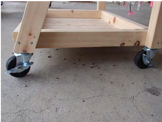
キャスター付きで移動もラクラク！