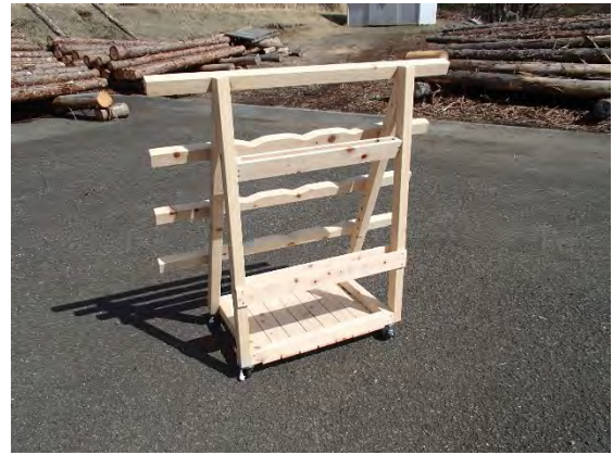
水源林管理所職員作製