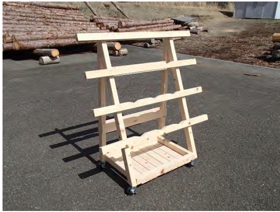
道志水源林間伐材使用