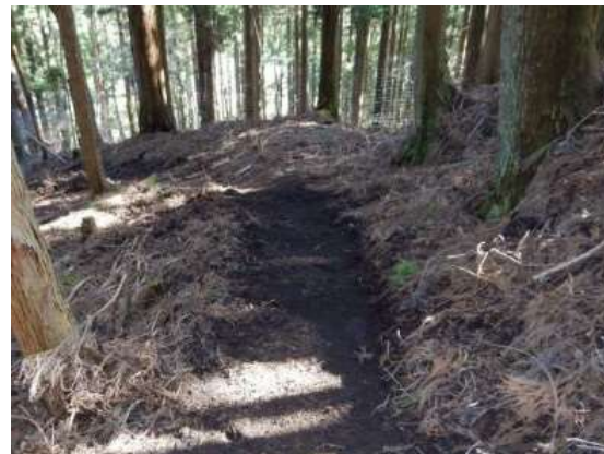
整備後の道の状況(管理所職員で整備しました。)