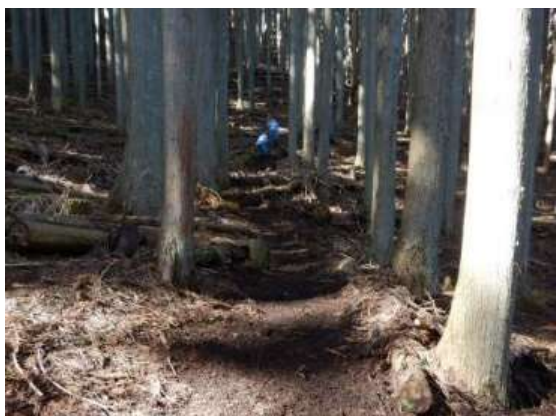
整備後の道の状況(管理所職員で整備しました。)