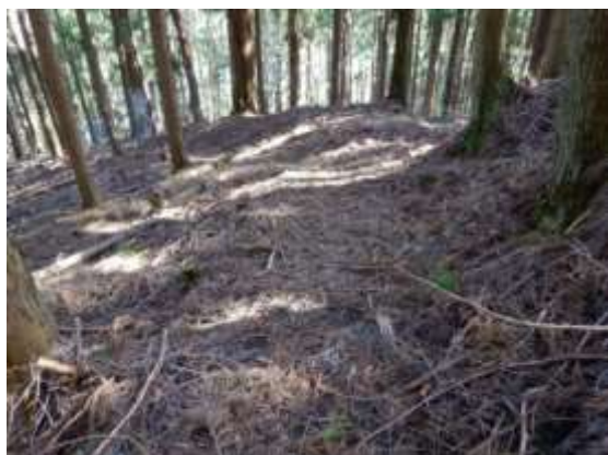
整備前の道の状況